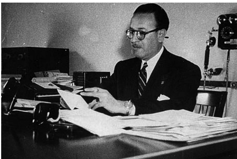
Eusebio Dávalos fue director del Museo Nacional de Antropología hasta 1958, año de su fallecimiento.

Dijeron de él, quienes lo conocieron y trataron, que logró la amistad y el cariño de